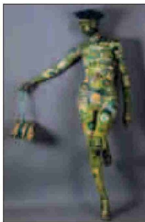
L'OPERA di Furnival a "Dadada".

DA OGGI fino a domenica Pavia ospita "Il Festival dei saperi", oltre 90 eventi culturali e scientifici, laboratori, mostre e spettacoli, dedicati al tema "L'uomo e il suo doppio. L'identità dell'uomo contemporaneo tra tecnica e umanesimo". Gli eventi toccheranno il centro storico della città. E domani, alle 19, al Castello Visconteo, sarà inaugurata la mostra "Dada-